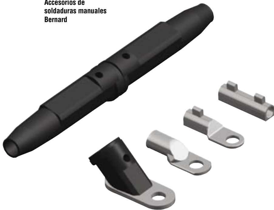
Accesorios de soldaduras manuales Bernard

Nuestros accesorios para soldaduras manuales ofrecen una alta calidad con una amplia variedad de estilos, tamaños y capacidades para mejorar sus aplicaciones de soldaduras.